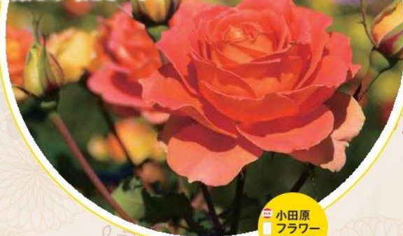
小田原フラワーガーデン