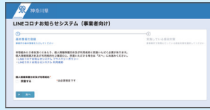
LINEコロナお知らせシステム 登録フォーム