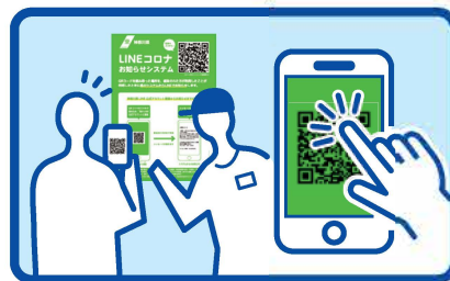
来店者にQRコードを 読み取って貰ってください