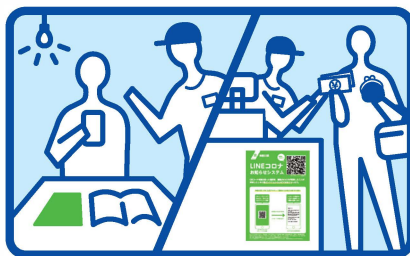
QRコード読取用紙は POPとして店内の目に触れる所に 配置してください