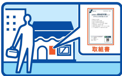
取組書は店先に掲示する