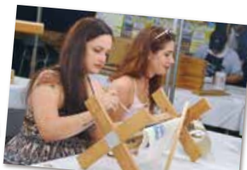
・小田原ちょうちん作り