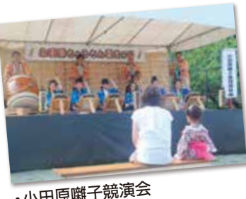
・小田原囃子競演会

小田原市ジュニア・リーダーズ・クラブ ヨーヨーつり、スーパーボールすくい 小江戸伝承工芸師 鮎善 鮎細工等